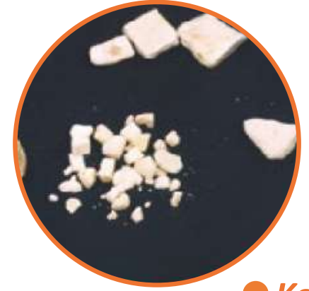
● Kokain Maddesi