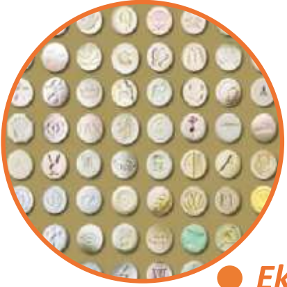
● Ekstasy (MDMA)