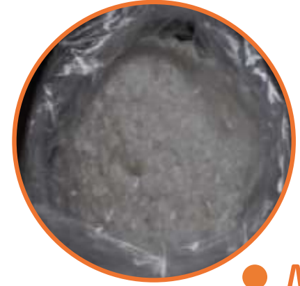
● Meth Maddesi