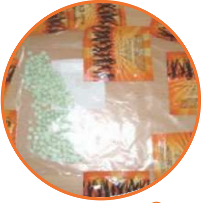
● Sentetik Kannabinoid