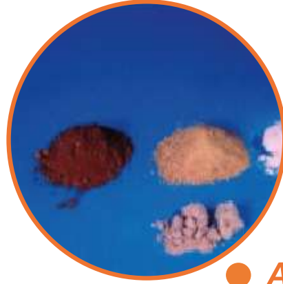
● Afyon Türevleri